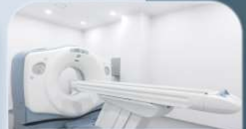
개인 맞춤 의료기기 추천 서비스