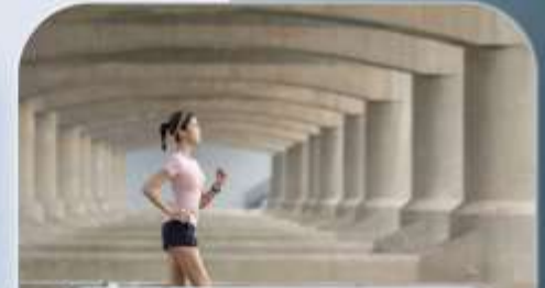
개인 맞춤 운동 프로그램 제공