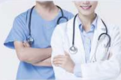
개인 맞춤 서플리먼트 추천 서비스