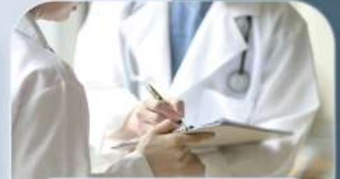
개인 맞춤 보험 연계 서비스