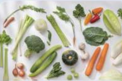
개인 맞춤 식단 서비스