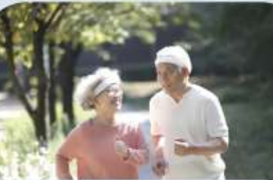
개인 맞춤 건강 콘텐츠 제공